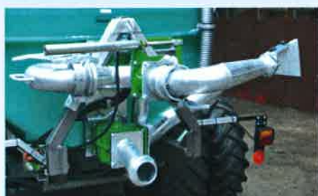
Hydraulische Weitwurfdüse mit Drehgelenk und einfach wirkendem Hydraulikanschluss