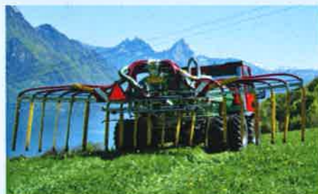
Schleppschlauchverteiler mit 3-Punktanbau kombinierbar