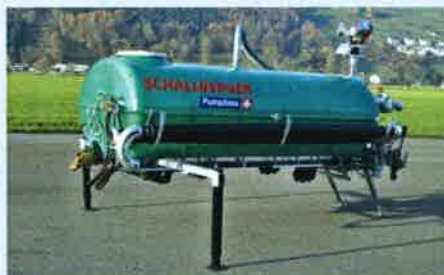
Stützen oder Aufhängevorrichtung