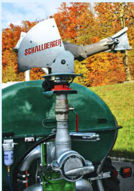
Jauche-Elektroverteiler mit T-Stück