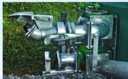
Eigenentwickelter Flächenverteiler / Schnellkuppler