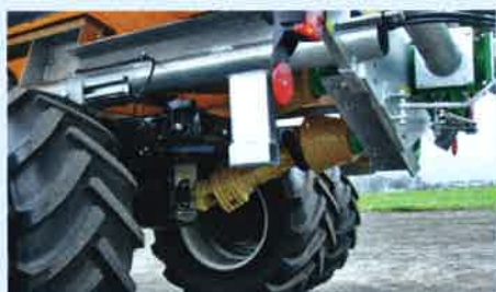
Antrieb über Winkelgetriebe- Einheit hinten