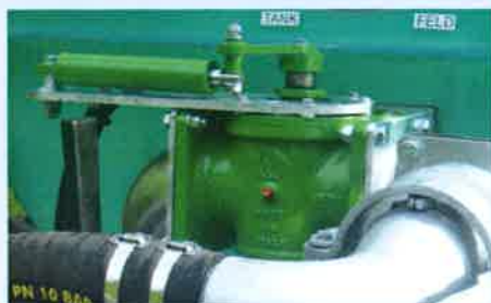
Hydraulische Betätigung des druckseitigen Schiebers (Serie)