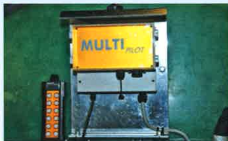
Funksteuerung mit Multipilot