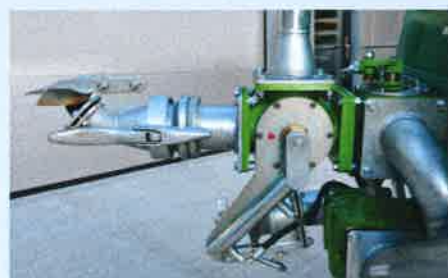
3. Schieber mechanisch oder hydraulisch