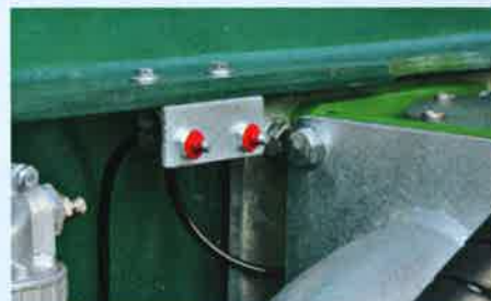
Zentralschmierung der Schieber